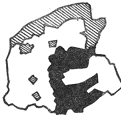
Typen fan wettermounen yn 1811 en har forsprieding. Swart: it gebiet mei in meartal fan skeprêdmounen. Skeanstreke: it gebiet dêr't allinne skroefmounen foarkomme.

Geane wy nei hwer't it skeprêd it meartal útmakket, dan komme wy by de gritenijen Haskerlân (49 fan de 60), Skoatterlân (35 fan de 51), Smellingerlân (18 fan de 21), Utingeradiel (112 fan de 149), Weststellingwerf (65 fan de 79), Idaerderadiel (153 fan de 221). Set men dit op 'e kaert út, dan kriget men ien great blok út it suden wei yn Fryslân op. It is de hoeke fan it lege lân, dêr't yn de 17de en 18de ieu al wakker feante wie en yn