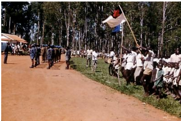
De onafhankelijkheid wordt gevierd

Niet lang hierna kwamen de 'blue hats' van de Verenigde naties zich legeren in Aru, Kongo. Het bleek een regiment uit Ethiopië. De commandant was medisch arts en een prachtkerel. Hij kwam geregeld naar ons toe om te vragen naar onze welstand. Soms zag je de VN soldaten samen patrouilleren met de Kongolezen. Vooral als de Kongolese soldaten wat teveel gedronken hadden, moesten ze door hun VN collega's in het gareel gehouden worden, zo goed of zo kwaad als dat ging.